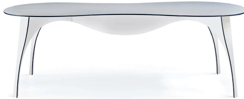
No Waste Table , Ron Arad, Honorable Mention at the Compasso d'Oro, 2008

ADI ADI ASSOCIAZIONE PER IL DISEGNO INDUSTRIALE DELEGAZIONE LOMBARDIA