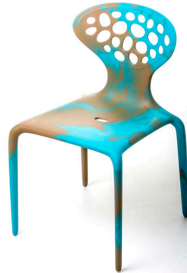
Supernatural , Ross Lovegrove, Honorable Mention at the Compasso d'Oro, 2008