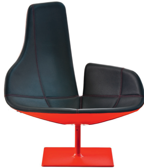
Fjord , Patricia Urquiola, Honorable Mention at the Compasso d'Oro, 2004