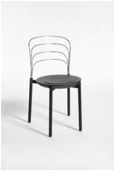
Sedia da soggiorno "Delfina"

La Giuria della XIV edizione ha deliberato di conferire il Premio Compasso d'oro 1987 alla sedia da soggiorno "Delfina" per l'impegno sapiente di tecnologie diverse in una sintesi poetica, anche strutturalmente ed ergonomicamente corretta.