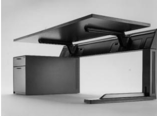
Sistema di mobili per ufficio "Dalle nove alle cinque"

La Giuria della XIV edizione ha deliberato di conferire il Premio Compasso d'oro 1987 al sistema di mobili per ufficio "Dalle nove alle cinque" per il fascino discreto di una soluzione tecnologica innovativa dei tradizionali elementi strutturali della scrivania, adeguati all'uso dei terminali elettronici, in un perfetto equilibrio formale.