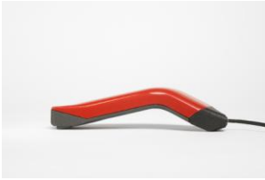
Telefono addizionale "Cobra"

La Giuria della XIV edizione ha deliberato di conferire il Premio Compasso d'oro 1987 al telefono addizionale "Cobra" per l'originalità dell'immagine e la corretta ergonomia di questo prodotto realizzato con soluzioni tecnologiche avanzate.