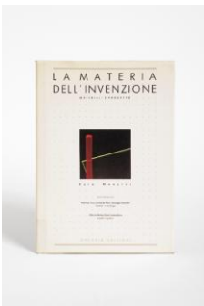
Libro "La materia dell'invenzione"

La Giuria della XIV edizione ha deliberato di conferire il Premio Compasso d'oro 1987 all'analizzatore di coagulazione "ACL/Automated Coagulation Laboratory" per avere saputo con un lay-out chiaro e rassicurante dare funzioni di analisi complesse realizzate con tecnologie sofisticate.