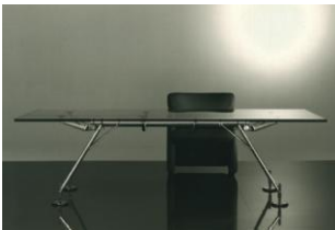
Sistema di tavoli e scrivanie per ufficio "Nomos"

La Giuria della XIV edizione ha deliberato di conferire il Premio Compasso d'oro 1987 al sistema di mobili per ufficio "Dalle nove alle cinque" per il fascino discreto di una soluzione tecnologica innovativa dei tradizionali elementi strutturali della scrivania, adeguati all'uso dei terminali elettronici, in un perfetto equilibrio formale.