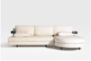
Sistema di sedute "Sity"

La Giuria della XIV edizione ha deliberato di conferire il Premio Compasso d'oro 1987 al telefono addizionale "Cobra" per l'originalità dell'immagine e la corretta ergonomia di questo prodotto realizzato con soluzioni tecnologiche avanzate.