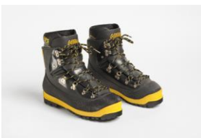
Scarpa per alpinismo "AFS 101"

La Giuria della XIV edizione ha deliberato di conferire il Premio Compasso d'oro 1987 al sistema di tavoli e scrivanie per ufficio "Nomos" per l'elevato risultato espressivo, emerso dalla raffinatezza della tecnica resa naturale dal felice incontro tra le concezioni innovative della Foster Associates e la cultura industriale della Tecno, in un rapporto di mutuaione tra progetto del prodotto e processo produttivo.