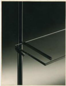
Libreria sistema "Hook-System"

La Giuria della XIV edizione ha deliberato di conferire il Premio Compasso d'oro 1987 al sistema di sedute "Sity" per il costante impegno dell'Azienda strettamente integrato con il contributo del designer ha condotto alla realizzazione di un prodotto tipologicamente avanzato in rapporto ai mutati atteggiamenti comportamentali dell'uomo nella casa. Si avvia così un processo di rinnovamento in un settore che da troppo tempo vedeva l'impegno dei designers costretto ad operare nell'ambito della sola tradizione.