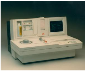
Analizzatore di coagulazione "ACL/Automated Coagulation Lab."

La Giuria della XIV edizione ha deliberato di conferire il Premio Compasso d'oro 1987 all'Arredo Urbano del Comune di Terni per per la coraggiosa iniziativa intrapresa dalla Città di Terni che la giuria intende mostrare come esempio al fine di avviare uno sviluppo organico di questo settore.