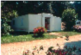
Unità abitativa pronto impiego "MPL Modulo Pluriuso"

La Giuria della XIV edizione ha deliberato di conferire il Premio Compasso d'oro 1987 ai laminati decorativi HPL "Diafos" per i contenuti innovativi del nuovo laminato presentato in anteprima per questa edizione del Compasso d'oro, quale risultato di un costante impegno nella ricerca tecnologica mai disgiunto da quello culturale attuato attraverso un rapporto esemplare con i designers.