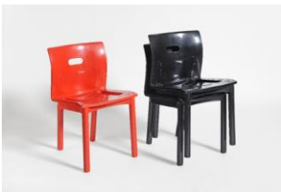
Sedia sovrapponibile "K 4870"

La Giuria della XIV edizione ha deliberato di conferire il Premio Compasso d'oro 1987 alla sedia da soggiorno "Delfina" per l'impegno sapiente di tecnologie diverse in una sintesi poetica, anche strutturalmente ed ergonomicamente corretta.