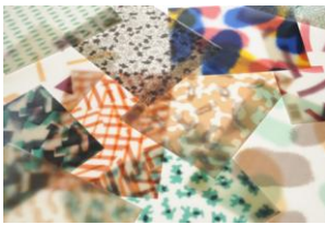
Laminati decorativi HPL "Diafos"

La Giuria della XIV edizione ha deliberato di conferire il Premio Compasso d'oro 1987 agli utensili "Forbici per Bonsai" perché con una particolare sensibilità per i rapporti con le forme naturali il giovane designer ha espresso fantasia creativa e attenta ricerca di polivalenza di funzioni.