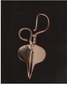
Utensili "Forbici per bonsai"

La Giuria della XIV edizione ha deliberato di conferire il Premio Compasso d'oro 1987 agli utensili "Forbici per Bonsai" perché con una particolare sensibilità per i rapporti con le forme naturali il giovane designer ha espresso fantasia creativa e attenta ricerca di polivalenza di funzioni.