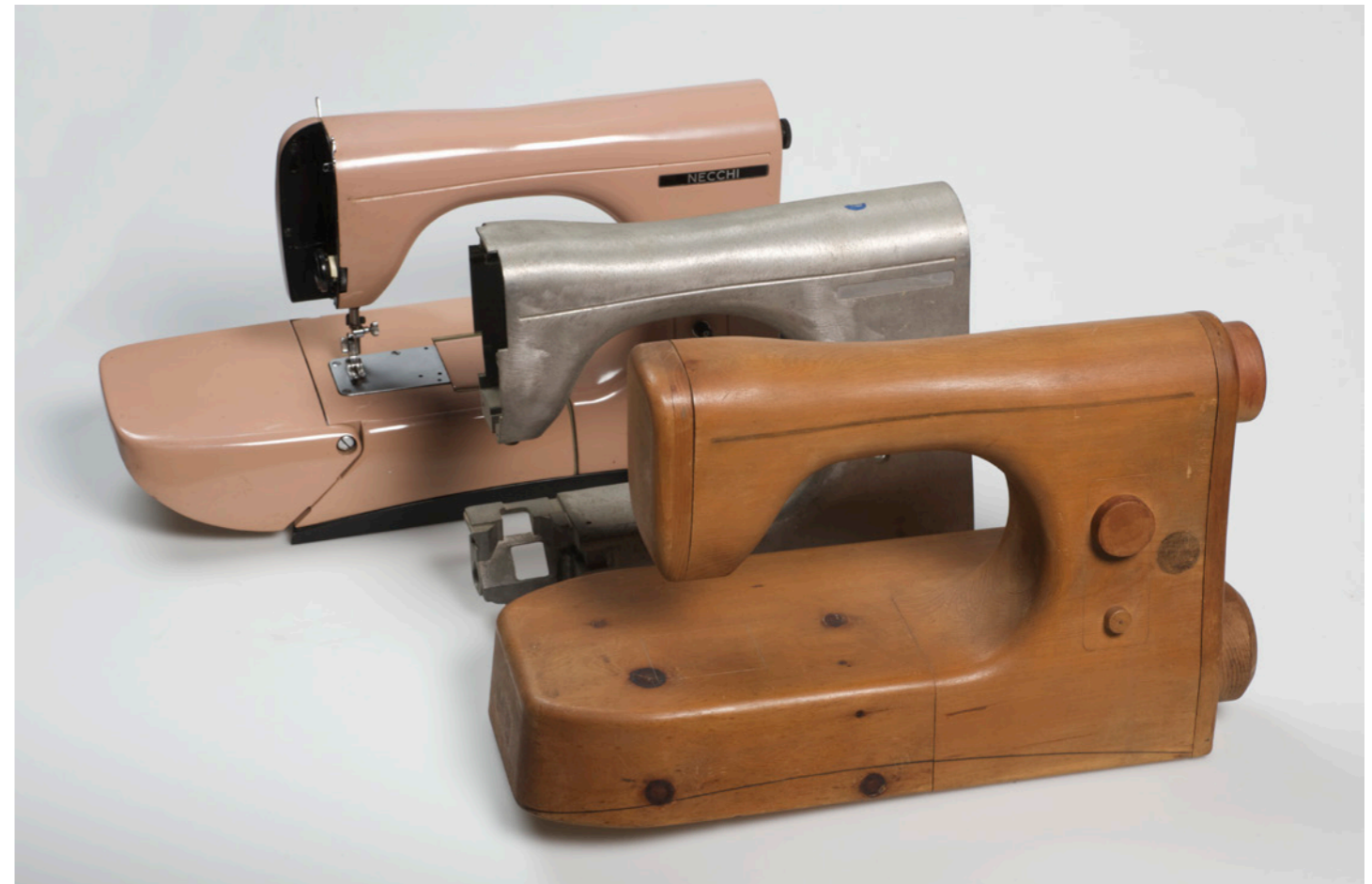
Giovanni Sacchi, Compasso d'Oro alla carriera, 1998

The Giovanni Sacchi Archives, dedicated to the famous model-maker for the field of design, is at the Spazio MIL in Sesto San Giovanni. The Giovanni Sacchi Archives, gathers an extensive amount of material (models, products, drawings, photographs, documents, equipment and tools) from Giovanni Sacchi's workshop, located in Via Sirtori in Milan and active through 1997. This model-making workshop was an important point of reference for many designers and architects, who were able to develop their projects, because in Sacchi they found the ideal correspondent to help them translate their design ideas into three-dimensional objects. An entire working environment has been reconstructed for educational purposes, to follow the process of creating an object, completed by an area equipped with new machinery where it will be possible to organize model-making workshops.