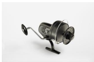
Mulinello "Atlantic" per la pesca da mare

Al mulinello della Alcedo viene attribuito il "Premio La Rinascente Compasso d'oro 1956" per lo sforzo con il quale il progettista ha inteso di far riconoscere un meccanismo come forma, studiandone attentamente i particolari. Il mulinello Alcedo mostra che in tutti i momenti della progettazione sono stati tenuti presenti tanto il fattore tecnico-economico quanto il fattore estetico-funzionale: il medesimo atteggiamento di fronte a tutti i momenti del progettare ha condotto ad una unità estetica.