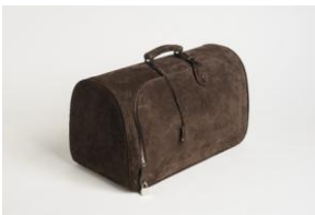
Valigia arcata in vitellone scamosciato

Il tappeto della Ditta Pugi è un esempio di tentativo intelligente di collegare i risultati dell'arte contemporanea alla decorazione dell'arredamento. Il progettista, nel libero ritmo degli elementi di colore, si preoccupa di rispettare anche visivamente il piano del pavimento; la qualità del materiale ha arricchito di effetti la sensibilità cromatica del pittore.