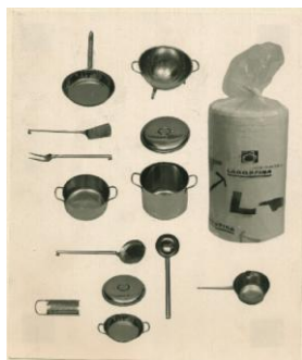
Utensili da cucina in acciaio inox in confezione dono

Al mulinello della Alcedo viene attribuito il "Premio La Rinascente Compasso d'oro 1956" per lo sforzo con il quale il progettista ha inteso di far riconoscere un meccanismo come forma, studiandone attentamente i particolari. Il mulinello Alcedo mostra che in tutti i momenti della progettazione sono stati tenuti presenti tanto il fattore tecnico-economico quanto il fattore estetico-funzionale: il medesimo atteggiamento di fronte a tutti i momenti del progettare ha condotto ad una unità estetica.