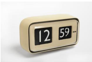
Orologio elettromeccanico "Cifra 5"

La valigia della Ditta Beretta a cui viene attribuito il "Premio La Rinascente Compasso d'oro 1956" è un esempio egregio di elaborazione di una forma tradizionale in un materiale che ne sottolinea l'aspetto sciolto e familiare. Il Compasso d'oro vuole sottolineare con il premio a questo prodotto, la qualità di perfetta esecuzione che presenta l'intera produzione della Ditta Beretta già altri anni segnalata.