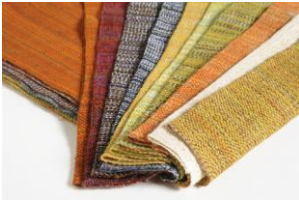
Tessuto per tende "JL"

Il Compasso d'Oro 1962 viene assegnato alla cucina a gas mod. 700 della "Rex Zanussi" per il significato costitutivo della presenza di un prodotto di costo modesto e di concezione industrialmente correttissima nel campo degli apparecchi domestici fondamentali. La realizzazione dell'uso dei materiali, mentre ha semplificato il ciclo produttivo ha rispettato e addirittura accentuato la funzionalità del prodotto. Esempio tipico di una soluzione di produzione in cui la ricerca della minimizzazione dei costi ha condotto ad una forma rigorosa ed essenziale.