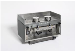
Macchina da caffè "Pitagora"