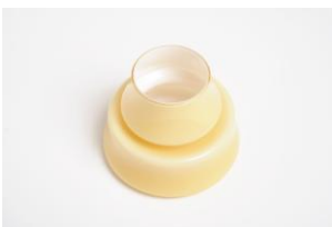
Vaso portafiori serie "Marco"

Al tavolo da pranzo, gioco e studio, viene destinato il Compasso d'Oro 1962 per l'impostazione progettistica che, superando la tradizionale concezione del tavolo composto di piano-fascia-gambe, realizza un prodotto qualitativamente elevato e nel contempo economico, destinato ad un largo consumo. Questo tavolo può essere considerato un ottimo esempio di integrazione di metodologia del design e di analisi dei materiali: questa integrazione ha permesso di conferire all'oggetto una struttura che utilizza la stessa elasticità degli elementi e un valore estetico, del complesso e del dettaglio, singolarmente rinnovato e culturalmente impeccabile.