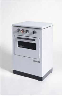
Cucina a gas Rex "Mod. 700"

Il Compasso d'Oro 1962 viene assegnato alla cucina a gas mod. 700 della "Rex Zanussi" per il significato costitutivo della presenza di un prodotto di costo modesto e di concezione industrialmente correttissima nel campo degli apparecchi domestici fondamentali. La realizzazione dell'uso dei materiali, mentre ha semplificato il ciclo produttivo ha rispettato e addirittura accentuato la funzionalità del prodotto. Esempio tipico di una soluzione di produzione in cui la ricerca della minimizzazione dei costi ha condotto ad una forma rigorosa ed essenziale.