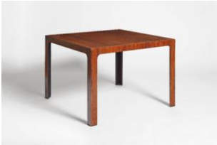
Tavolo da pranzo, gioco e studio

Il Livello mod. 5169 cui viene assegnato il Compasso d'Oro 1962. è risultato di una progettazione rigorosa e pertinente in particolare per gli aspetti di "human engineering ". Si riconoscono, nella aderenza della forma esterna alla geometria specificamente strumentale e nelle soluzioni tecniche studiate in funzione di una regolazione tattile, le caratteristiche salienti della funzionalità globale dello strumento.