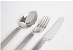
Servizio di posate "Dry"

L'armadio "Sisamo" si distingue per il modo quasi magico, ma nello stesso tempo non macchinoso, nel quale il problema delle ante scorrevoli è stato risolto con acuta attenzione.