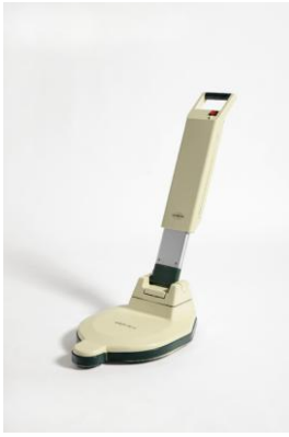
Lucidalavapavimenti "FB 33"

Soluzione corretta e coerente per un prodotto di larga diffusione nel quale sono stati studiati con attenzione alcuni particolari come l'efficienza operativa anche nella pulitura degli angoli e la riduzione ad un ingombro contenuto quando l'oggetto viene riposto.