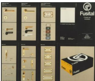
Immagine grafica coordinata Fusital

Tentativo riuscito di integrare il progetto grafico nelle operazioni complesse ed a volte contaminate dagli aspetti commerciali dell'industria televisiva. La componente visuale è uno strumento essenziale di espressione verso il sociale, la cui importanza è fondamentale nel campo della comunicazione.