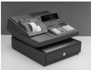
Registratore di cassa "Mercator 20"

Soluzione corretta e coerente per un prodotto di larga diffusione nel quale sono stati studiati con attenzione alcuni particolari come l'efficienza operativa anche nella pulitura degli angoli e la riduzione ad un ingombro contenuto quando l'oggetto viene riposto.