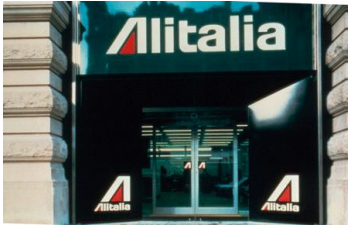
Immagine coordinata e progetto per agenzie passeggeri