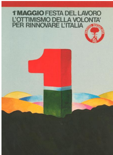
Immagine grafica Partito socialista italiano

Progetto di una macchina utensile che è l'espressione della ricerca di base in un settore industriale in rapido sviluppo. Il risultato è un prodotto nel quale i fattori di configurazione modulare, dei sistemi di controllo e delle misure di sicurezza sono integrati con attenta considerazione del valore architettonico complessivo.