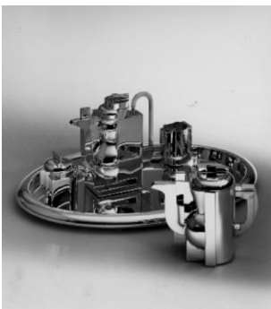
Servizio da tè e caffè

Nel servizio "Dry" è espressa la corretta fusione tra la tradizione classica della forma e il fresco contributo personale del designer. Il delicato passaggio tra il disegno delle parti a contatto con la mano e gli elementi funzionali delle posate è risolto con felice scioltezza.