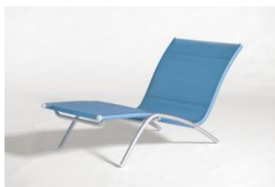
Chaise longue "Bikini"

Nel quadro di una promozione dell'uso del mezzo di trasporto pubblico nell'ambiente urbano privilegia l'attenzione per l'utente con soluzioni di ordine funzionale come la facilità di accesso e l'interno più confortevole grazie all'ampia luminosità e all'adozione di finiture sensorialmente più gradevoli.