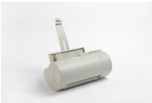
Stampante a colori "Artjet 10"

La proposta di una forma mnemonica in chiave ironica adotta tecniche sofisticate nella esecuzione produttiva, offrendo all'utenza un prodotto in pieno rispetto delle funzioni richieste a costo molto contenuto.