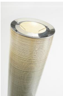
Lampade "Tite, Mite"

Flessibilità d'uso per le infinite e facili possibilità di collocazione in interni ed esterni. Sostenuta economicità e valida ricerca formale per l'impiego di componenti in gran parte già esistenti in produzione, che attualizza nella propria configurazione contenuti già sperimentati nelle preesistenti tipologie.