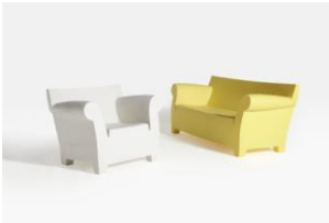
Divano e poltrona "Bubble Club"

Innovazione tecnologica nell'utilizzo di un materiale appositamente progettato, facilità di manutenzione e pulizia, leggerezza e conformazione caratterizzano un oggetto di grande semplicità e dal design essenziale per espressività estetica nella risposta funzionale.