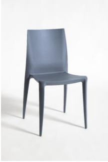
Sedia impilabile "The Bellini Chair"

Innovazione tecnologica nell'utilizzo di un materiale appositamente progettato, facilità di manutenzione e pulizia, leggerezza e conformazione caratterizzano un oggetto di grande semplicità e dal design essenziale per espressività estetica nella risposta funzionale.