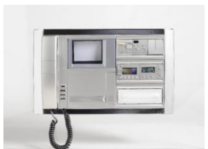
Sistema domotico "My Home"

La persistenza di grande originalità, nell'utilizzo innovativo di un materiale sintetico esclusivo, garantisce all'oggetto flessibilità di posture e di collocazione in interni e in esterni.