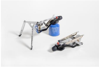
Fornelletto pieghevole da trekking "Scorpio 270"

Riuscito tentativo di risolvere il tema delle attrezzature per il tempo libero, orientando la ricerca a soluzioni tendenti alla facilitazione dell'uso e alla semplificazione delle operazioni costruttive del prodotto, per un costo contenuto e una produzione in grande serie.