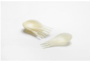
Forchetta/cucchiaio usa e getta "Moscardino"

Testimonia, tra le prime soluzioni tipologiche, il ruolo del valore espressivo segnaletico affidato a un'armatura di illuminazione per esterno in grado di integrare il ruolo primario funzionale della luce stradale armonizzandolo in rapporti e misure adeguati per il paesaggio.