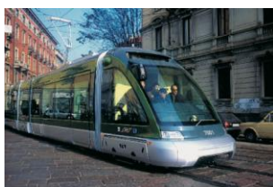
Sistema di trasporto pubblico di superficie "Eurotram per Milano"

Nel quadro di una promozione dell'uso del mezzo di trasporto pubblico nell'ambiente urbano privilegia l'attenzione per l'utente con soluzioni di ordine funzionale come la facilità di accesso e l'interno più confortevole grazie all'ampia luminosità e all'adozione di finiture sensorialmente più gradevoli.