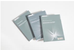
SDI - Sistema Design Italia

La giuria, prendendo atto del valore della ricerca già precedentemente effettuata nell'ambito della produzione di beni di consumo della categoria "usa e getta", mette in evidenza il risultato lodevole di questo ulteriore sviluppo, cogliendo il valore degli ultimi studi, tradotti in oggetti di consumo con il beneficio della biodegradabilità.