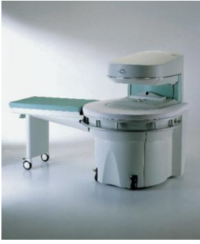
Apparecchiatura per risonanza magnetica "E-Scan"

Afferma la necessità del design in tutte le categorie merceologiche, testimoniando il rispetto nei confronti dell'utente e offrendo una soluzione semplificata rispetto alla produzione corrente e in grado di assicurare un migliore equilibrio psicologico dei pazienti.