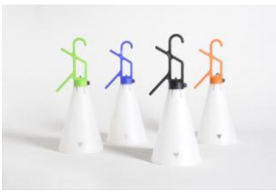
Apparecchio illuminotecnico "May Day"

Afferma la necessità del design in tutte le categorie merceologiche, testimoniando il rispetto nei confronti dell'utente e offrendo una soluzione semplificata rispetto alla produzione corrente e in grado di assicurare un migliore equilibrio psicologico dei pazienti.