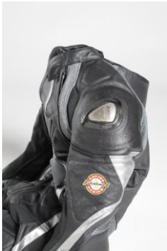
Tuta in pelle per motociclismo "T-Age Suit"

Riuscito tentativo di risolvere il tema delle attrezzature per il tempo libero, orientando la ricerca a soluzioni tendenti alla facilitazione dell'uso e alla semplificazione delle operazioni costruttive del prodotto, per un costo contenuto e una produzione in grande serie.