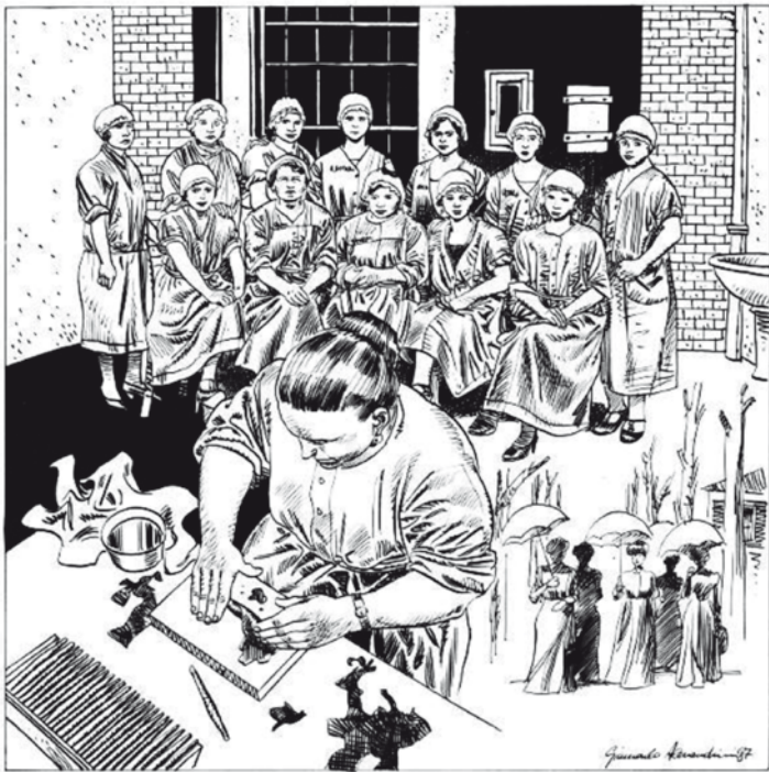
disegno di Giancarlo Alessandrini