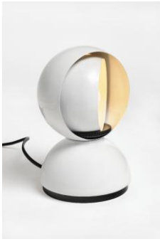
Lampada da tavolo "Eclisse"

La Commissione stima che l'oggetto presentato abbia la doppia qualità di un alto valore progettistico-estetico e di una possibile diffusione di massa. Sottolinea inoltre la novità della soluzione tecnica che, con un semplice movimento a schermo rotante, gradua l'intensità dell'erogazione luminosa.