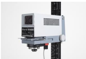
Ingranditore e riproduttore fotografico "Durst A 600"

La Commissione rileva la estrema semplicità dell'oggetto che riassume le diverse funzioni di apparecchi di mole e struttura molto maggiore e libera l'utente dalla servitù di un filo di collegamento, inglobando i comandi negli auricolari, e ne sottolinea l'adeguatezza del materiale alla esecuzione.