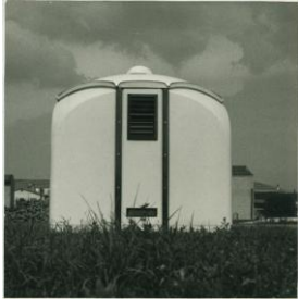
Capanno turistico "Guscio"

La Commissione ravvisa in questo prodotto l'alta qualità di componibilità la semplicità dell'impianto e il facile adattamento al paesaggio e ravvisa inoltre un originale approccio al problema della costruzione in serie suscettibile di ulteriori interessanti sviluppi.