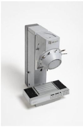
Macchina utensile "Auctor Multiplex MUT/40A"

La Commissione stima di particolare interesse l'inserimento di un design di alto livello nel campo delle macchine utensili, sia per le implicazioni progettistiche che ne comporta il design, sia per l'importanza della macchina utensile a controllo numerico, espressione di una tecnologia avanzata, nell'economia nazionale e nella esportazione, sia per la necessità di rendere sempre più coerente alla vita moderna l'ambiente del lavoro.