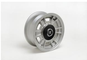
Cerchio in lega leggera

La Commissione apprezza in tutta la serie la semplicità e la fungibilità del prodotto, che risolve il problema della illuminazione da tavolo, da parete e da soffitto con un identico elemento illuminante, attraverso facili modulazioni del sostegno.