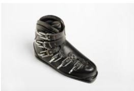
Scarpone da sci "4S"

La Commissione ravvisa in questo prodotto l'alta qualità di componibilità la semplicità dell'impianto e il facile adattamento al paesaggio e ravvisa inoltre un originale approccio al problema della costruzione in serie suscettibile di ulteriori interessanti sviluppi.