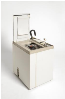
Lavabiancheria superautomatica Rex "Mod. P5"

La Commissione ravvisa in questo prodotto la validità della presentazione unitaria e compatta dei singoli elementi tra di loro intimamente integrati e sottolinea particolarmente l'ottima soluzione della scala sulla piastra di sostegno, che conferisce all'ingranditore eccezionale stabilità, facilità e sicurezza di impiego, eliminando ogni inutile sovrastruttura.