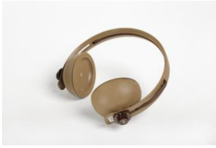
Apparecchio ricevitore 6 canali traduzione simultanea via radio

La Commissione rileva la estrema semplicità dell'oggetto che riassume le diverse funzioni di apparecchi di mole e struttura molto maggiore e libera l'utente dalla servitù di un filo di collegamento, inglobando i comandi negli auricolari, e ne sottolinea l'adeguatezza del materiale alla esecuzione.