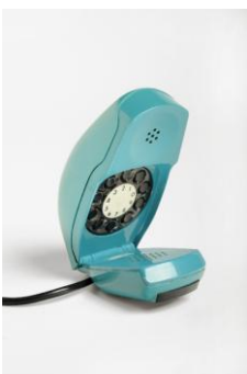
Apparecchio telefonico "Grillo"

La Commissione ravvisa in questo prodotto una interessante soluzione del sistema di chiusura a fibbia, perfezionato con l'inserimento di un dispositivo a molla che permette una corretta elasticità della chiusura, e sottolinea inoltre l'alta qualità di lavorazione del prodotto e l'euritmia delle proporzioni.